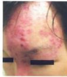
目の合併症のリスクが 高い帯状疱疹