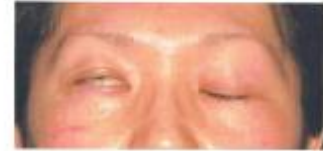
帯状疱疹による顔面神経麻痺